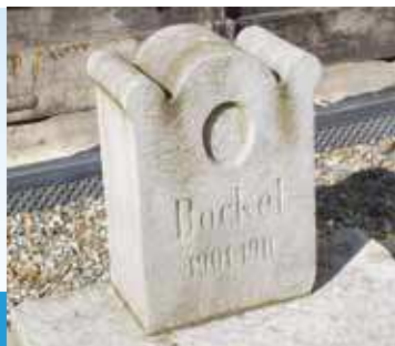
Psi nagrobek z 1901 roku, fot. 2014

Na wyspie pośrodku dawnego stawu w czasach Frankenbergów grzebano pańskie psy myśliwskie, które dokonały żywota. Nic dziwnego, że miejsce to nazywano psim cmentarzem. Jeden z odnalezionych tam nagrobków psów zobaczyć można przy bramie południowego skrzydła pałacu.