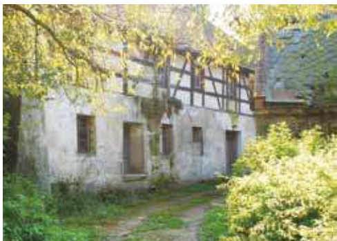
Tułowicki młyn, fot. 2013

Przy kamiennych schodach tarasu splata się kilka ścieżek. Pójdźmy w prawo, w kierunku narożnej furtki, prowadzącej poza ogrodzenie parku. Tuż za furtką ścieżka biegnąca w prawo zaprowadzi nas na teren dawnego młyna. To jeden z ciekawszych zakamarków parku. Młyn, obiekt o konstrukcji szkieletowej stojący na kamiennej podmurówce, zbudowany został w XVIII w. Jeszcze w latach 80. XX w. mełło się tu zboże, choć napęd młyna był już wówczas elektryczny. W tym czasie zdjęto też wielkie młyńskie koło,