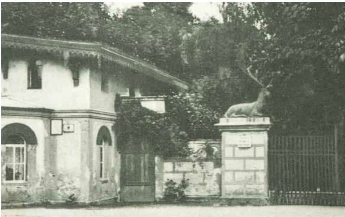
Dawny wjazd do parku w Tułowicach, fot. 1928

W pobliżu szkoły znajdziemy jeszcze jeden obiekt charakterystyczny dla pałacowego parku. Jest to główna brama wjazdowa na teren dawnej rezydencji. Niegdyś miejsce to wyglądało inaczej. Przy bramie znajdował się mały budynek portierni, a przy nim dwa naturalnej wielkości jelenie odlane z brązu, które posadowione na cokołach bramy ozdabiały wejście do parku. Odlewy jeleni wykonała huta w Tułowicach Małych. Po 1945 roku portiernię wyburzono, a figury jeleni wywieziono.