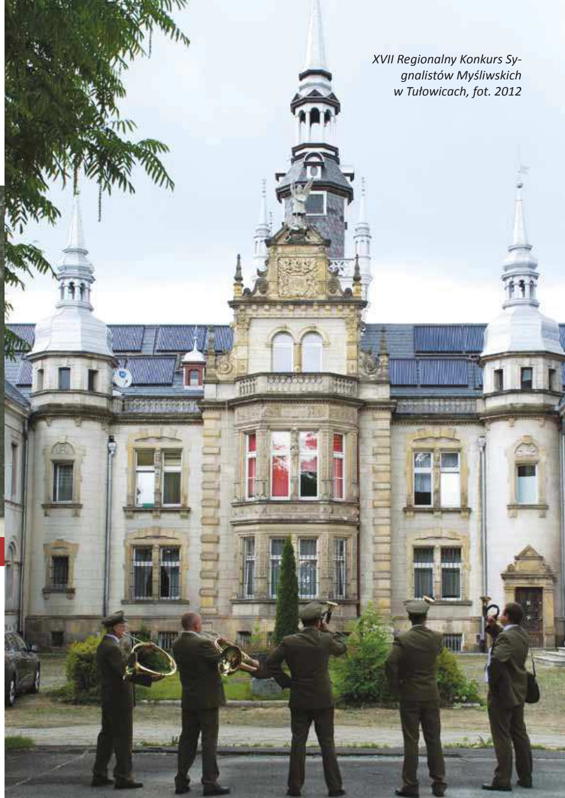
XVII Regionalny Konkurs Sygnalistów Myśliwskich w Tułowicach, fot. 2012

Tułowicki pałac szczęśliwie przetrwał czasy wojenne. W 1945 roku założono tu najpierw bazę traktorzystów, a w 1949 pierwszą polską szkołę leśną. Spacerując wokół budowli z łatwością odnajdziemy wiele oryginalnych elementów i detali architektonicznych. Inaczej jest wewnątrz budowli. Do dziś zachowały się jedynie pojedyncze elementy wyposażenia niektórych pomieszczeń, głównie fragmenty posadzek, boazerii oraz ozdobnej sztukaterii o motywach geometrycznych i myśliwskich. Większość wewnątrz jeszcze w latach 30. XX wieku, zaraz po upaństwowieniu majątku tułowickich Frankenbergów - a potem w latach 50. - została przebudowana. Zaadaptowano je najpierw na mieszkania, a potem na szkołę i internat.