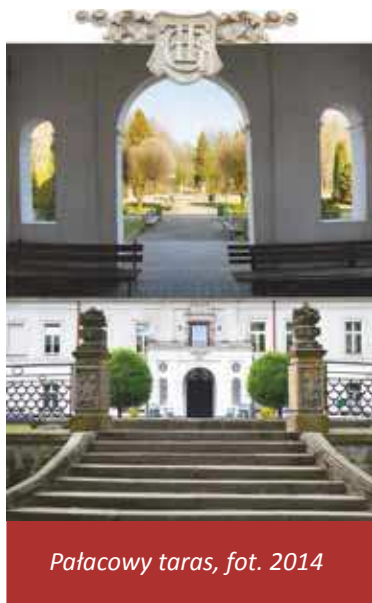
Pałacowy taras, fot. 2014

Sam taras, w kształcie jakim go oglądamy, powstał stosunkowo późno, bo dopiero w 1896 roku. Z tego też okresu pochodzi jego ozdobne, metalowe ogrodzenie i kamienna fontanna. Za fontanną znajdują się kamienne schody prowadzące do parku. Zejdźmy nimi na dół.