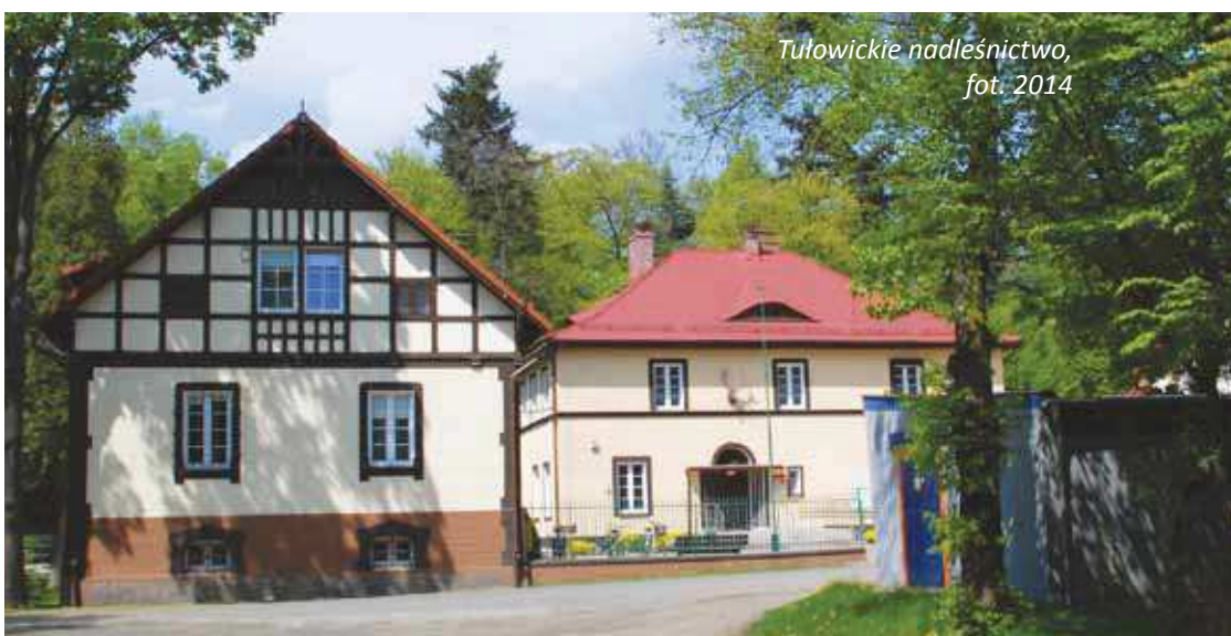
Tułowickie nadleśnictwo, fot. 2014

Po zwiedzeniu młyna idziemy ul. Parkową obok tułowickiego nadleśnictwa w kierunku widocznego z daleka małego pałacyku. Wybudowano go pod koniec XIX wieku i nazywano „willą Schlegelmilcha”.