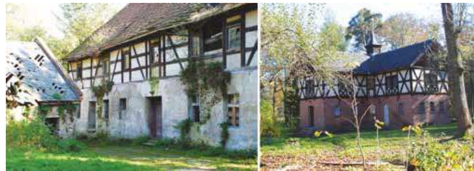
Tułowicki młyn i bażantarnia. fot. 2013

które wcześniej przez długie lata napędzało żarna. Do niedawna jeszcze zabytkowy młyn prezentował się nieźle, jednak w latach 90. XX wieku, po zmianie właściciela, obiekt został zaniedbany. Obecnie jest już w stanie ruiny, jednak mimo tego dalej zachwyca swoją oryginalnością.