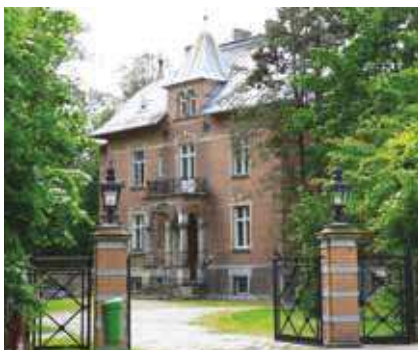
Willa Schlegelmilcha, fot. 2010

Od 2003 r. pałacyk stanowi własność prywatną i nie jest udostępniany do zwiedzania.