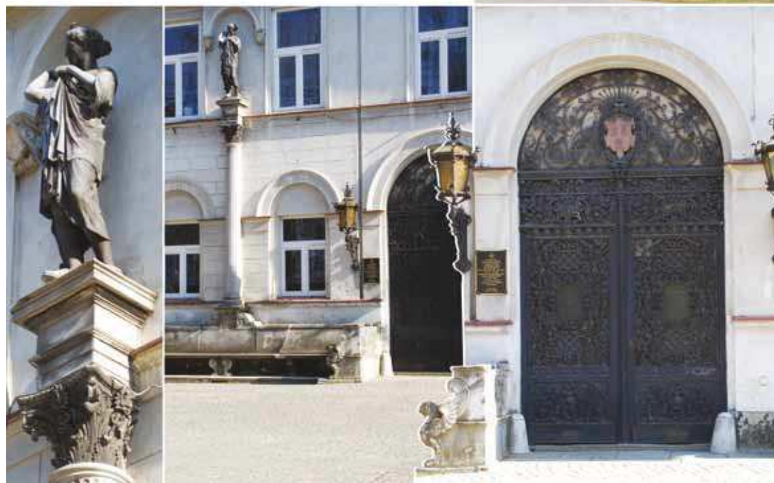
Zachodnie skrzydła pałacu i wyróżniające się elementy jego wystroju, fot. 2014

Zwiedzanie pałacu najlepiej rozpocząć od reprezentacyjnego skrzydła zachodniego. Tutaj na uwagę zasługuje wysoka kolumna zwieńczona figurą bogini łowów Diany oraz stojąca pod nią masywna marmurowa ława ozdobiona rzezbami gryfów - wszystko dłuta mistrza Pausenbergera z Wrocławia. Imponująca jest również brama kowalskiej roboty, osadzona obok ławy. Wykonał ją znany metaloplastyk E.Puls z Berlina. Łukowaty portal ozdabiają dwie duże latarnie. Całość tworzy reprezentacyjny wjazd prowadzący do wnętrza niegdyś przelotowej sieni.