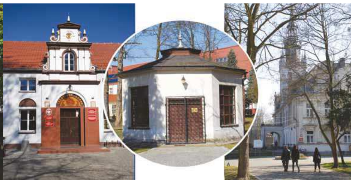
Zabytkowe budowle na terenie parku użytkowane przez Zespół Szkół, fot. 2014

Spacerując ulicą Parkową dochodzimy do ogrodzenia parku. Korzystając z małej, bocznej furtki udajemy się w kierunku widocznego z daleka pałacu. Po drodze mijamy ciekawe okazy drzew i krzewów, których na terenie parku jest wiele. Rozpoznanie poszczególnych gatunków ułatwiają tabliczki z nazwami zawieszane na większości drzew. Chodząc po parku nie sposób ominąć budynku szkoły. Pierwotnie była to stajnia dworska, wybudowana na początku XIX wieku; obok odnajdziemy również wiekową parkową altanę.